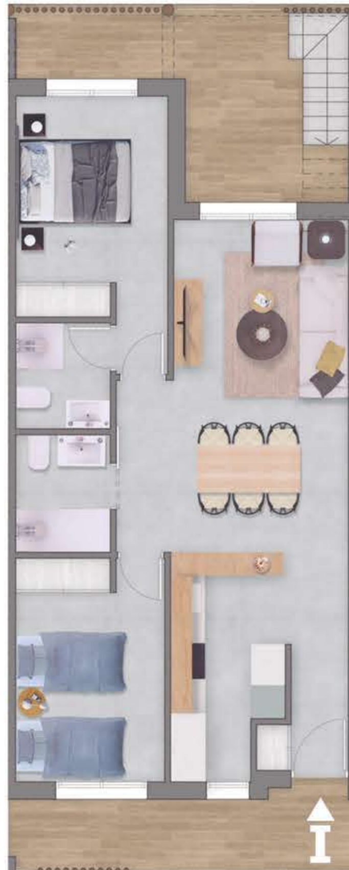
Planta primera / First Floor