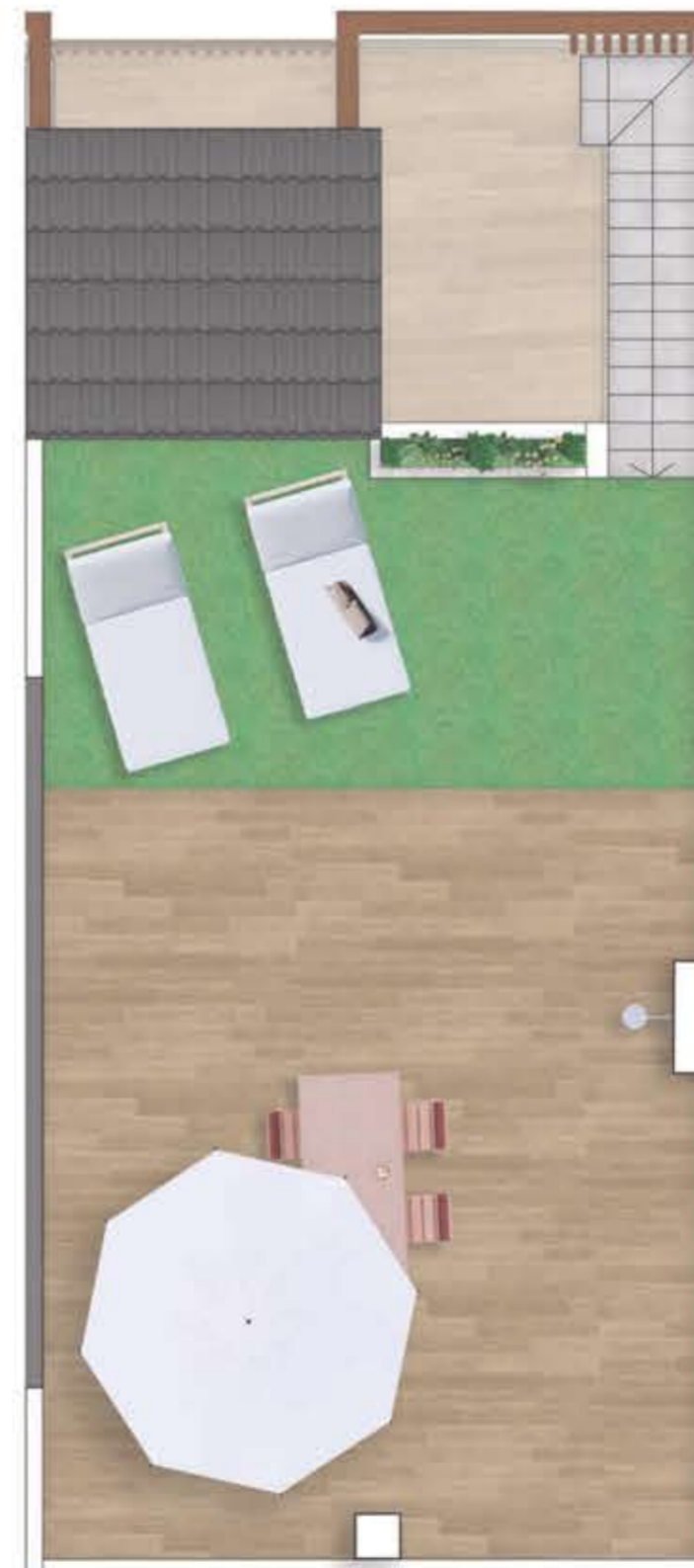
Planta solarium/ Topfloor