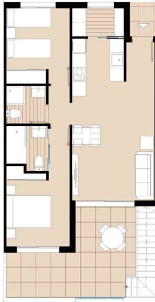
First Floor/ Planta Primera (E:1/100)