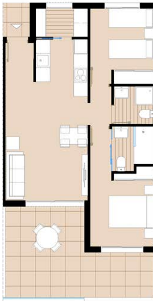
First Floor/ Planta Primera (E:1/100)