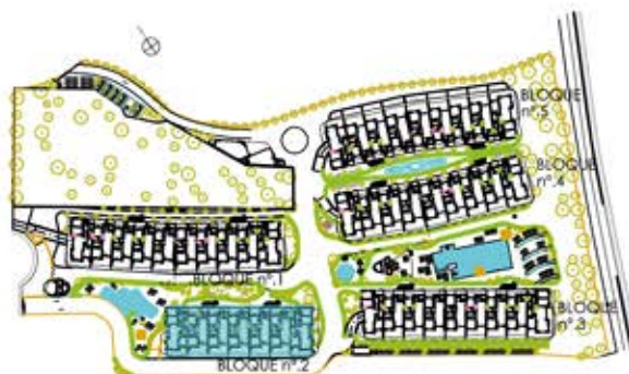
bloque 2 ordenacion general

VIVIENDA TIPO 4 dormitorios BLOQUE 2 ESCALERA 1 PLANTA ÁTICO